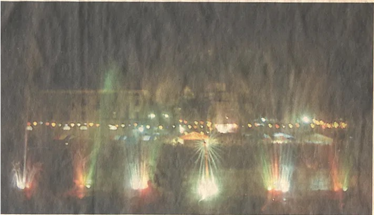
Wasserspiele vor der Kulisse des historischen Packhofes und den Schlagden: Beim Stapelmarkt am Samstag abend lockte trotz nicht gerade berauschenden Wetters das Spektakel aus Wasser und Licht einige tausend Besucher an.

in der HNA, Ausgabe Minden an der Weser, am 13.9.1994,