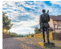
Mit dem Bartenwetter über die Brücke.