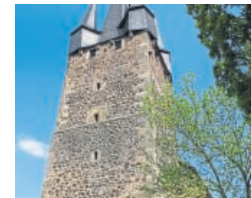
Geschichtsträchtig: die Harler Bonifatiuskirche.