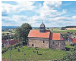
Imposant: die Kapelle Schönberg.