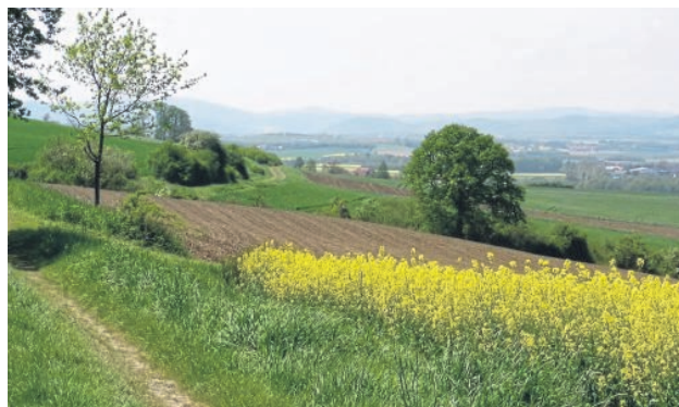
Weiter Blick: Dieses Foto hat der Autor zwischen Rhünda und Harle (Schwalm-Eder-Kreis) gemacht.

Kapitel enthalten knappe Eindrücke von unterwegs, Erinnerungen, überraschende Denkanstöße, und immer Beschreibungen der Landschaft, denen der Dipl.-Mineraloge bereits den Bildband „Das Hessische Bergland“ gewidmet hat. Als Experte sieht er Buntsandsteinfelsen, Muschelkalk, Quarzit-Gerölle und Lössbedeckungen. Wege sind für ihn nie einfach nur dies, sondern „historisch bedingte Errungenschaften ersten Ranges“, die es zu bewahren gelte. Schmidt-Döhl informiert über die in Leiferde