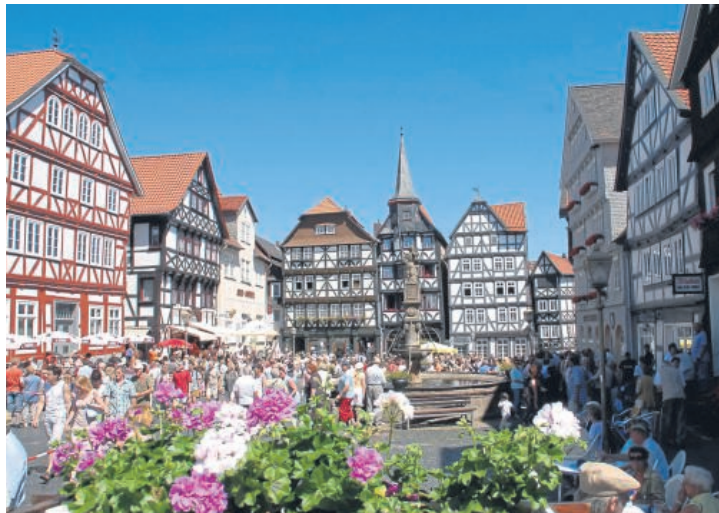
Das Fachwerk auf dem Fritzlärer Marktplatz hat die Redaktion von Lonely Planet überzeugt. Die Domstadt gehört zu den beliebtesten Reisezielen Deutschlands.