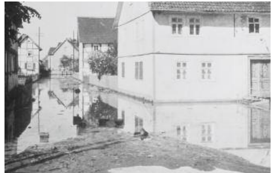
Diese Bilder können nur einen kleinen Eindruck von dem Leid vermitteln, welches die Menschen in Harle und in anderen Dörfern entlang des Ederflusses in der Folge des Bruchs der Edertalsperre in der Nacht auf den 17. Mai 1943 erlebt haben.