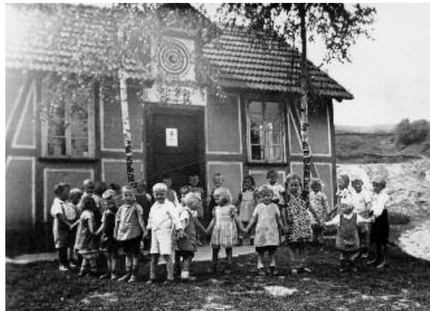
Kinder spielen vor dem Schützenhaus im Lehmgraben.