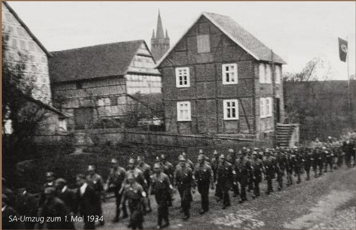
SA-Umzug zum 1. Mai 1934