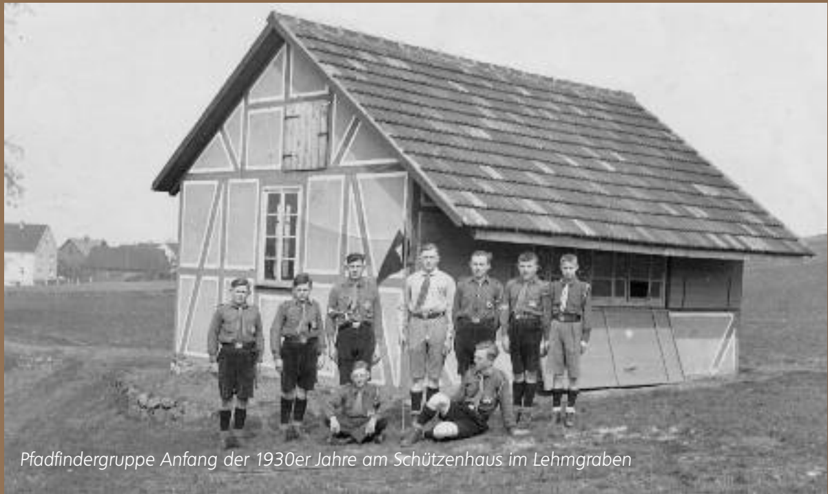
Pfadfindergruppe Anfang der 1930er Jahre am Schützenhaus im Lehmgraben