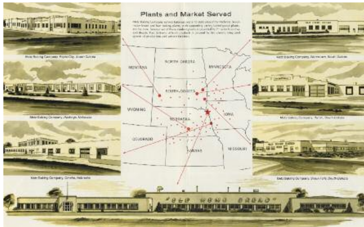
Die „Metz Baking Company“ im Jahr 1969 mit den wichtigsten Standorten ihrer Brotfabriken und den Vertriebszentren im Mittleren Westen der USA. Die Hauptzentrale mit Sitz in Sioux City ist auf dem Bild ebenfalls zu erkennen.