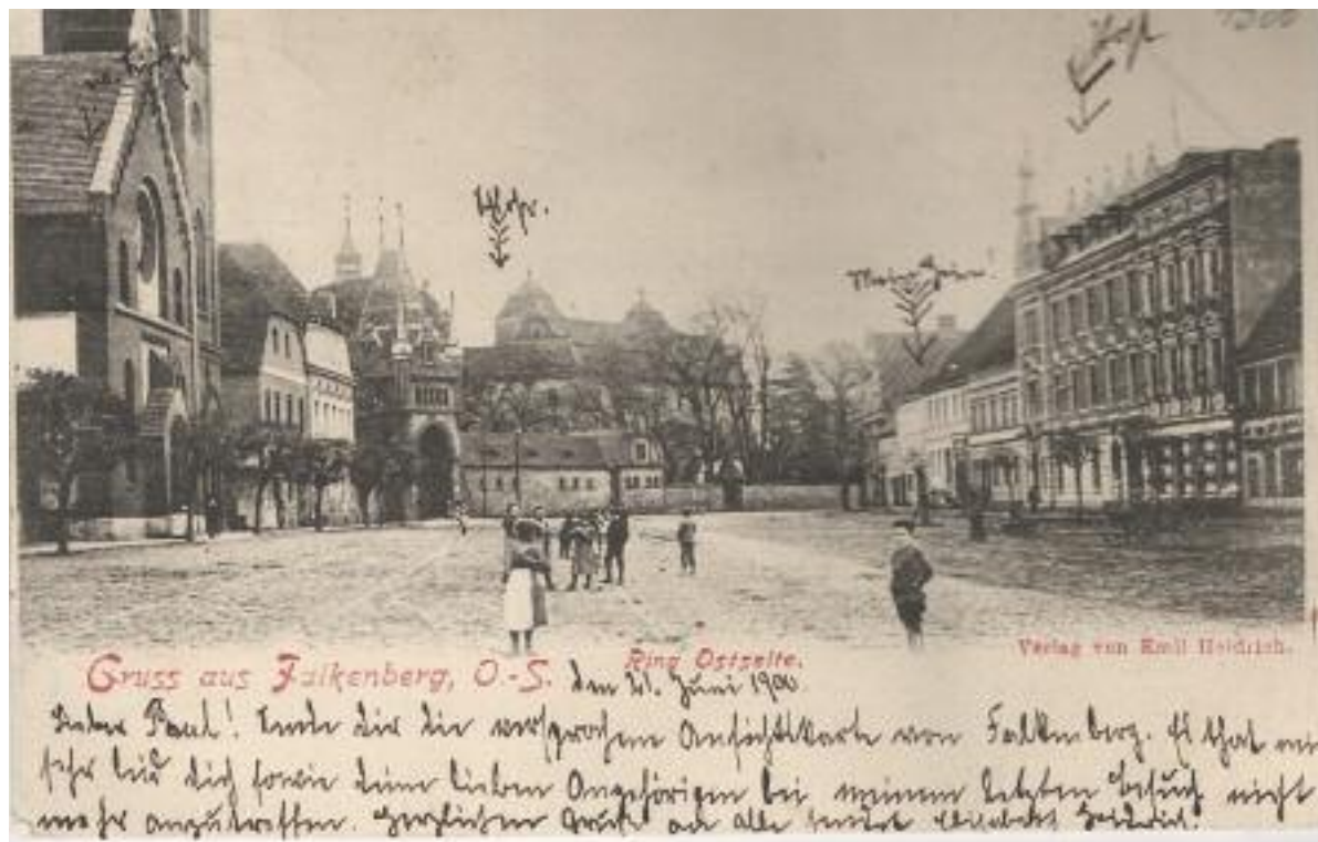
Historische Postkarte der Stadt Falkenberg in Ober-Schlesien aus dem Jahr 1900.

Für eine Gemeinde war es schon eine Herausforderung, so viele Flüchtlinge aufzunehmen und zu versorgen. Ich kann mich noch erinnern, dass wir vom Winter 1945 bis zum