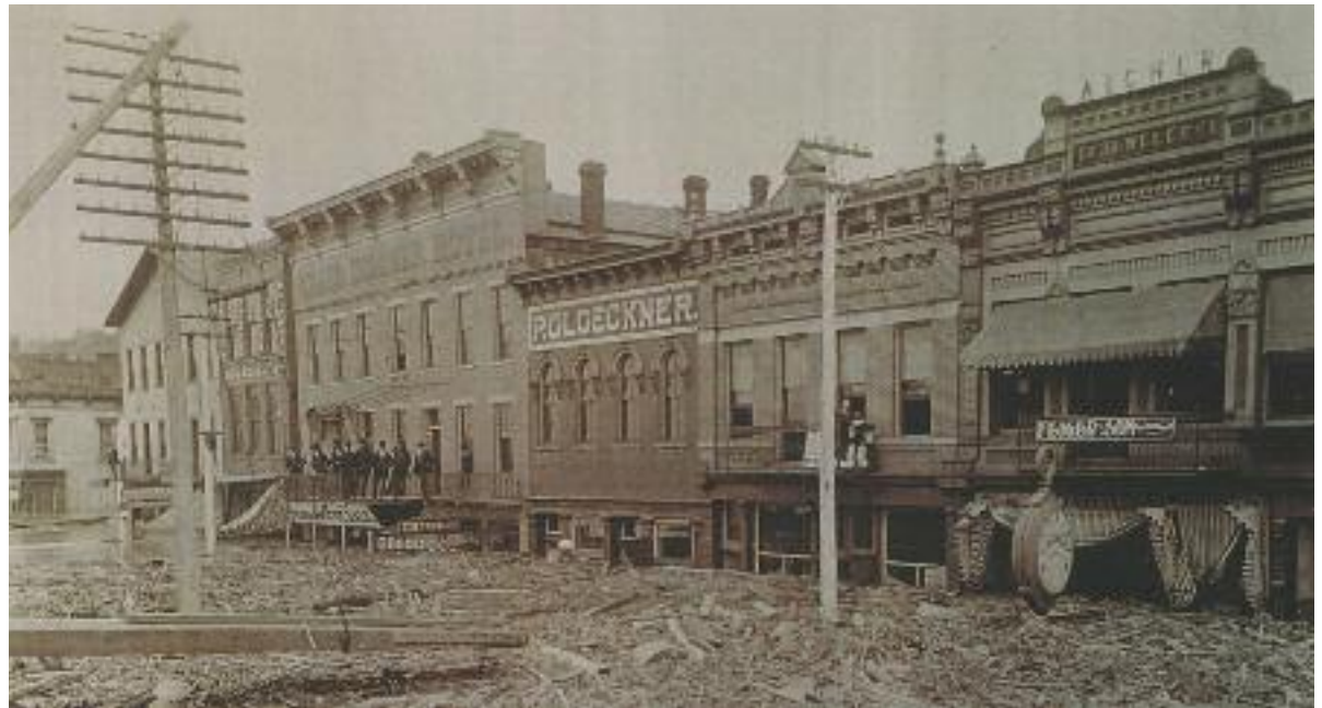
Hochwasser in Pomeroy, 1884.