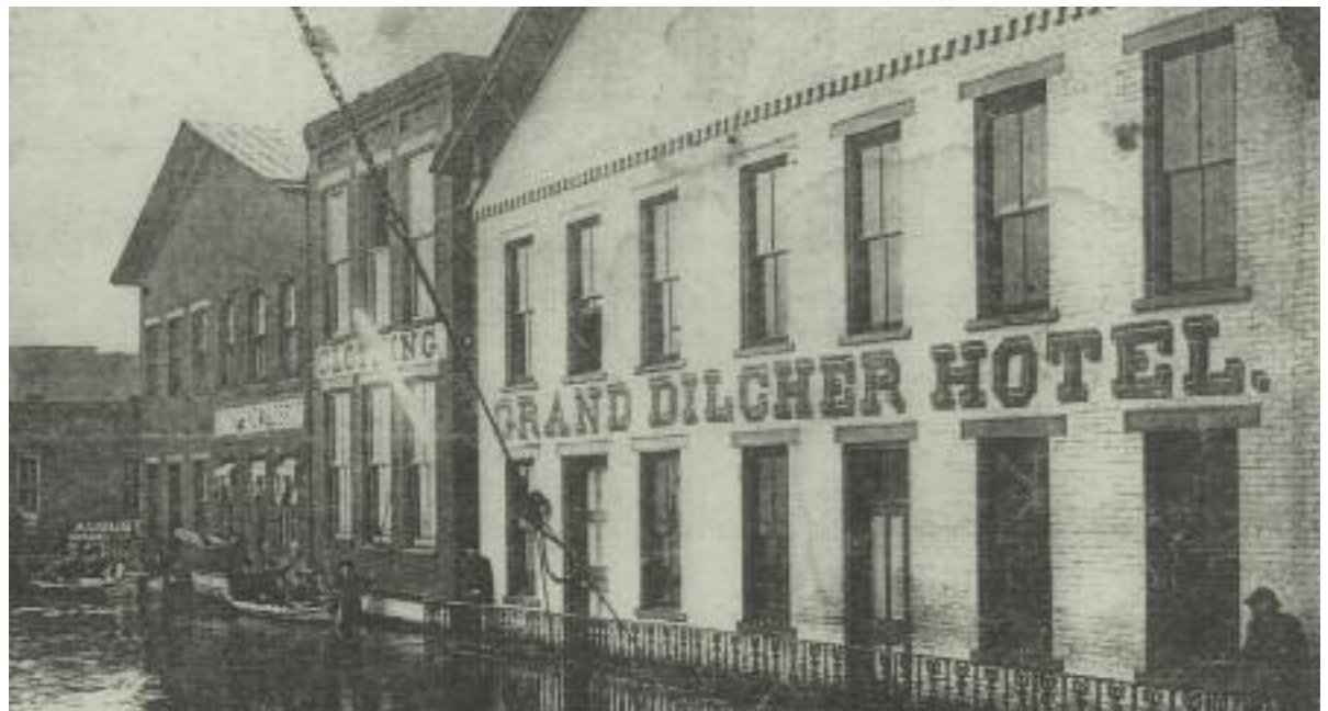
Pomeroy, Ohio, Ende des 19. Jahrhunderts. Das „Grand Dilcher Hotel“ ist in der Bildmitte zu sehen.