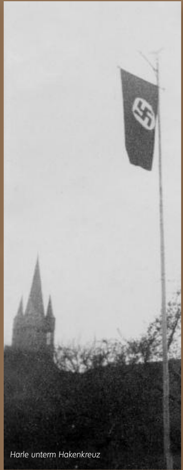
Harle unterm Hakenkreuz