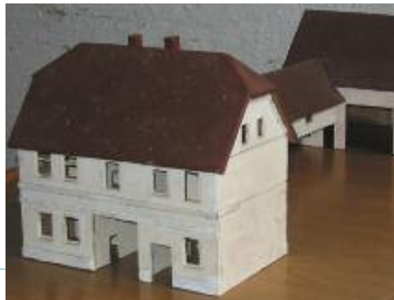
Dieses Modell des heimatlichen Hofes in Lingau fertigte Franz Wurm als Spielzeug für seine Söhne. Die handwerkliche Arbeit ist heute noch erhalten.