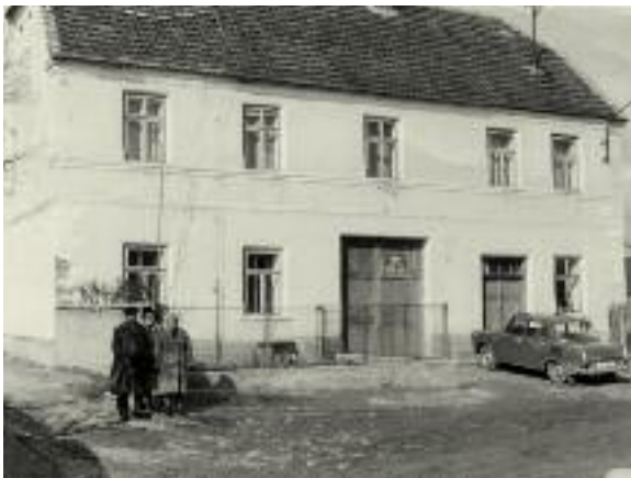
Die Vorderansicht des Hofes in Lingau, aufgenommen im Jahre 1970, zeigt den schlechten Zustand des Anwesens.